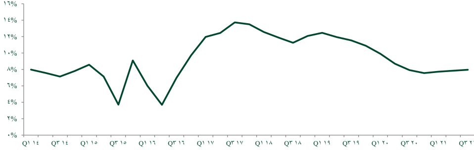
صندوق استثمار بنك الشركة المصرفية العربية الدولية الثالث (الراجح)